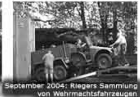
September 2004: Riegers Sammlung von Wehrmachtsfahrzeugen